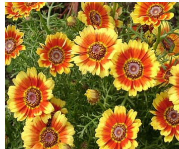
ζ) ετήσιο χρυσάνθεμο