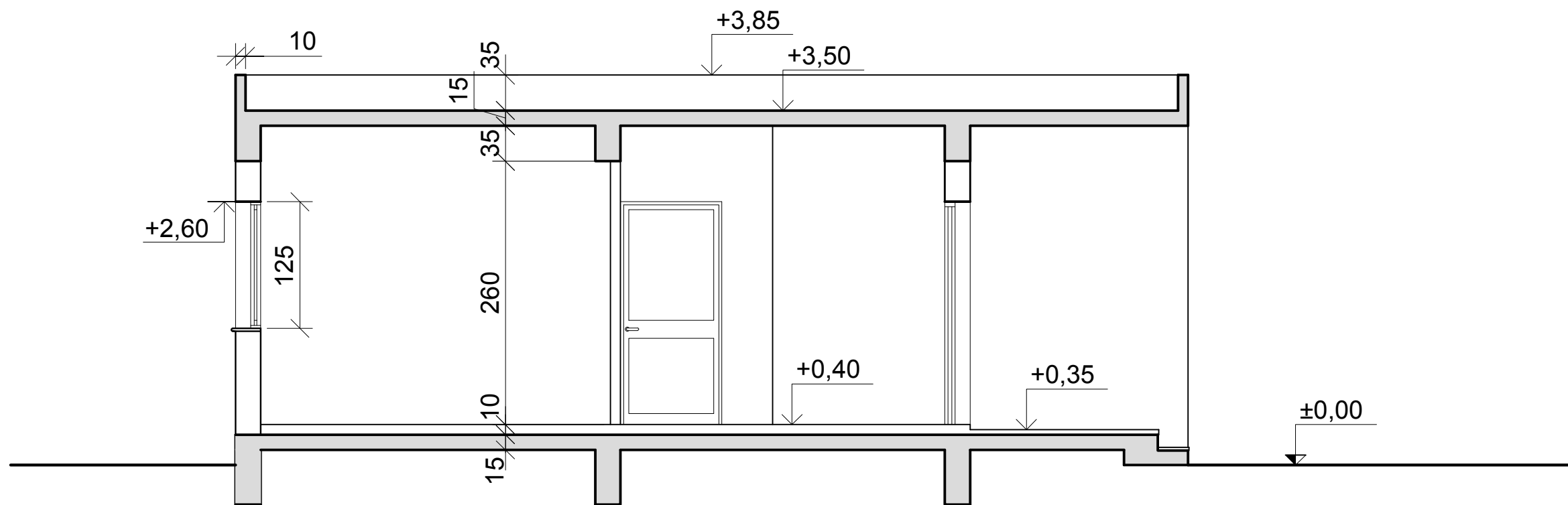
TOMH A-A ΚΛ. 1:50