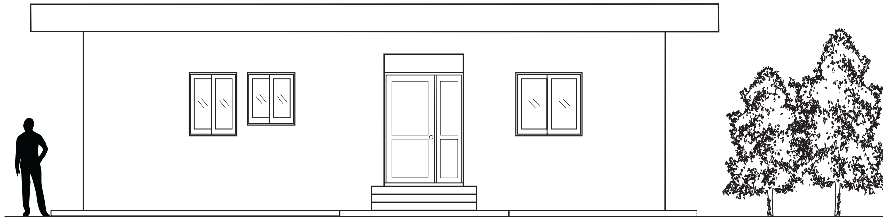
ΠΡΟΣΟΨΗ (ΝΟΤΙΑ ΟΨΗ) ΚΛ. 1:50