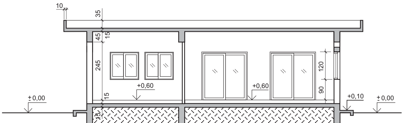
ΤΟΜΗ Α-Α ΚΛ. 1:100