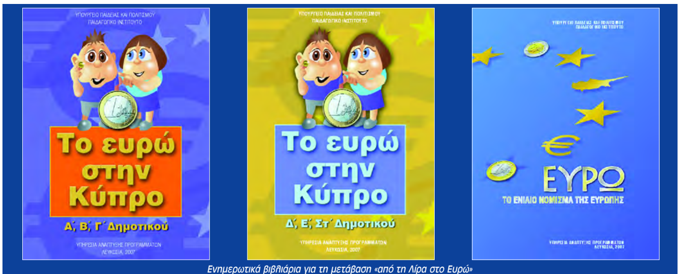
Ενημερωτικά βιβλιάρια για τη μετάβαση «από τη λίρα στο Ευρώ»