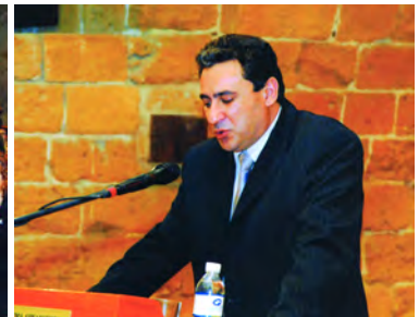
Ημερίδα για τον Οδυσσέα Ελύτη