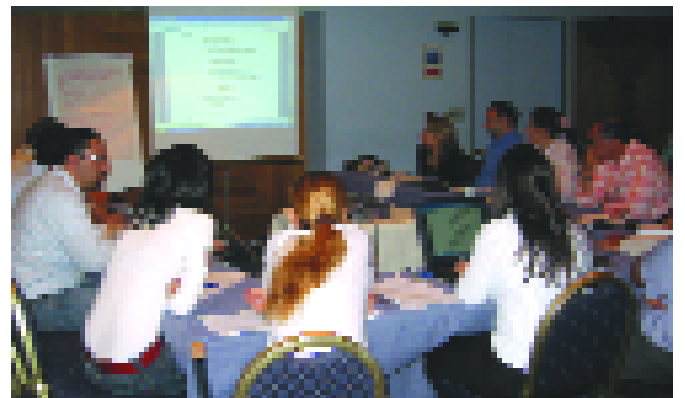
Επιμόρφωση και Κατάρτιση 2010 Εργαστήρια με θέμα "Διαδικτυακές Κοινότητες Εκπαιδευτικών"